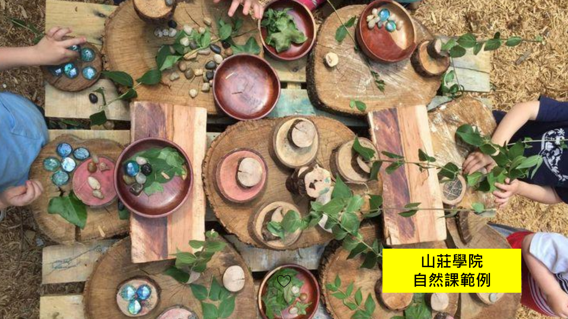
山莊學院 自然課範例