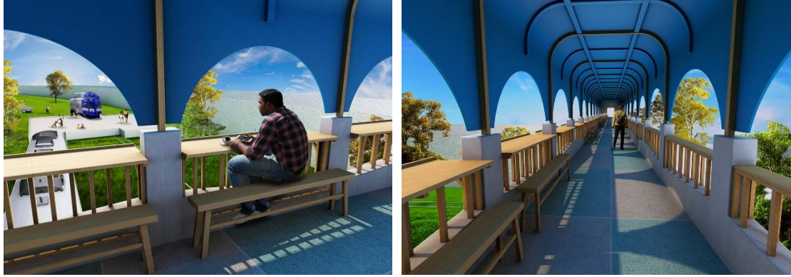
行人陸橋修繕改良後模擬圖